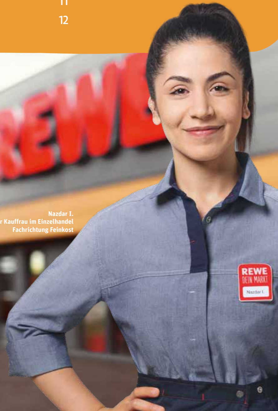
Nazdar I. Azubi zur Kauffrau im Einzelhandel Fachrichtung Feinkost

Bitte beachte: Aus Gründen der besseren Lesbarkeit wurde in der Regel die männliche Schreibweise verwendet. Wir weisen an dieser Stelle ausdrücklich darauf hin, dass sowohl männliche und weibliche als auch divers geschlechtliche Personen in den entsprechenden Texten gemeint sind.