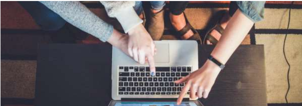
BSc Business Informatics