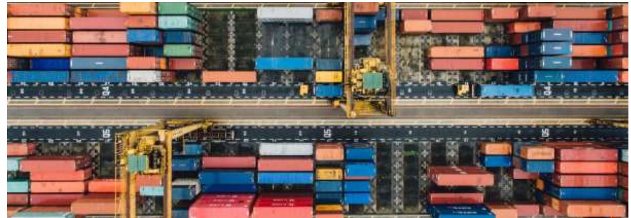
BSc Logistics Management