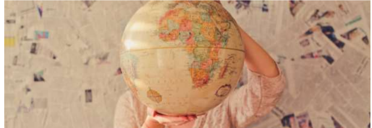
BSc International Management