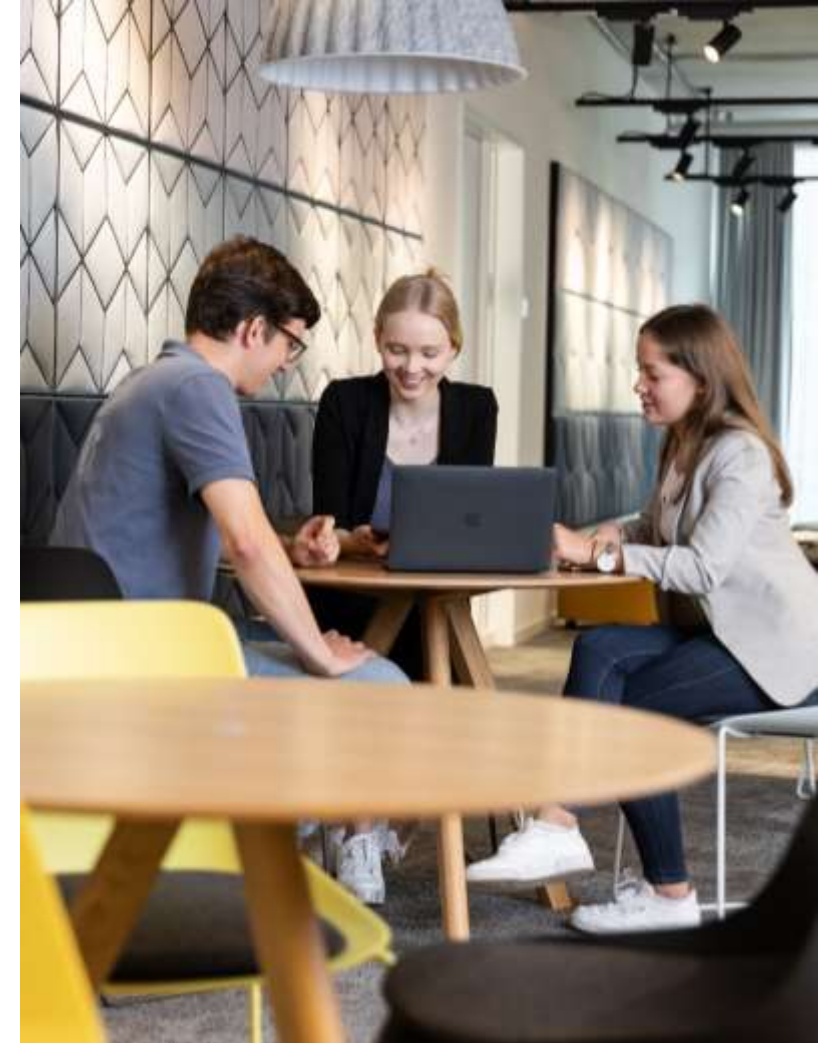
4 duale Bachelor-Programme in Präsenz mit Online-Elementen