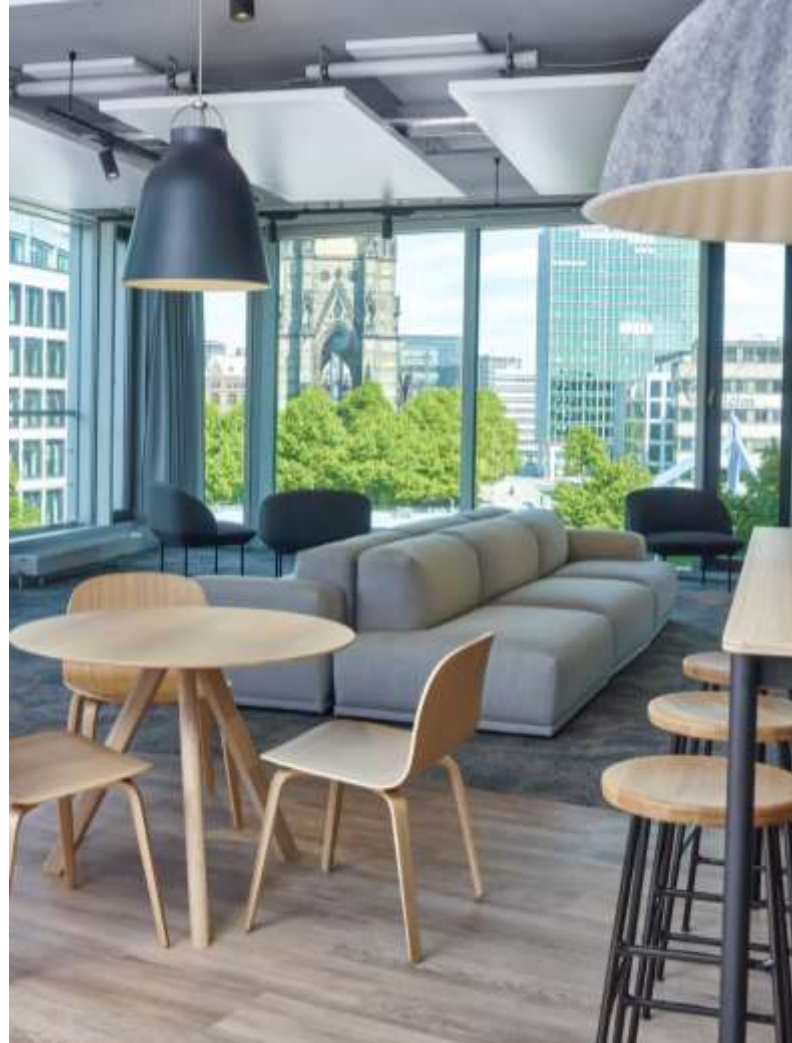
Gemeinschaftsbereiche und Seminarräume mit moderner technischer Ausstattung