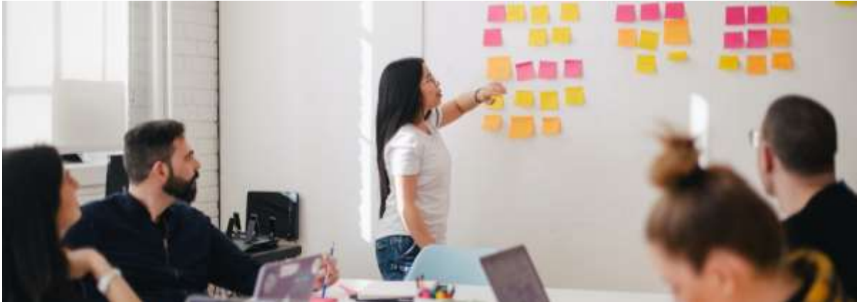
BSc Business Administration