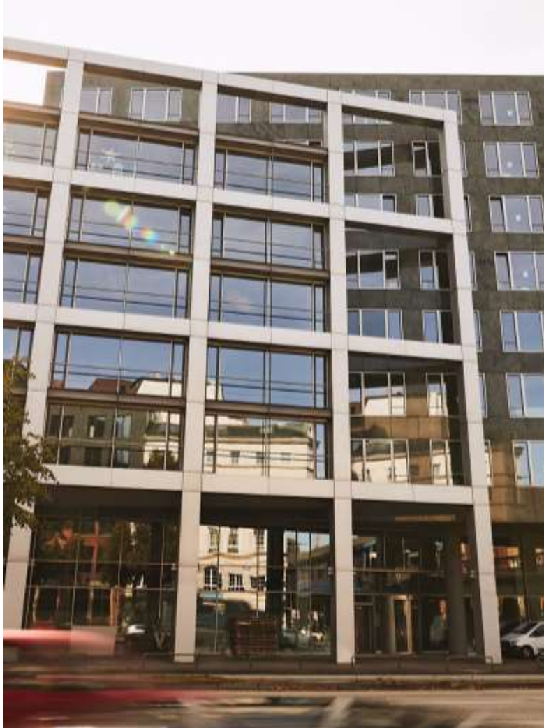
Die duale Hochschule mit langjähriger Erfahrung